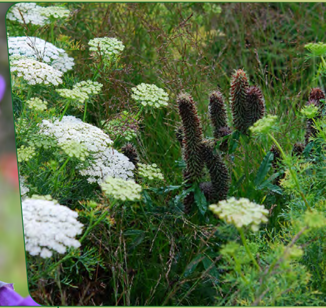
Bischofskraut | Ammi visnaga