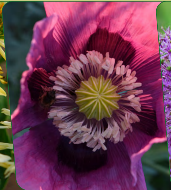
Türkischer Mohn | Papaver orientale „Patty's Plum“