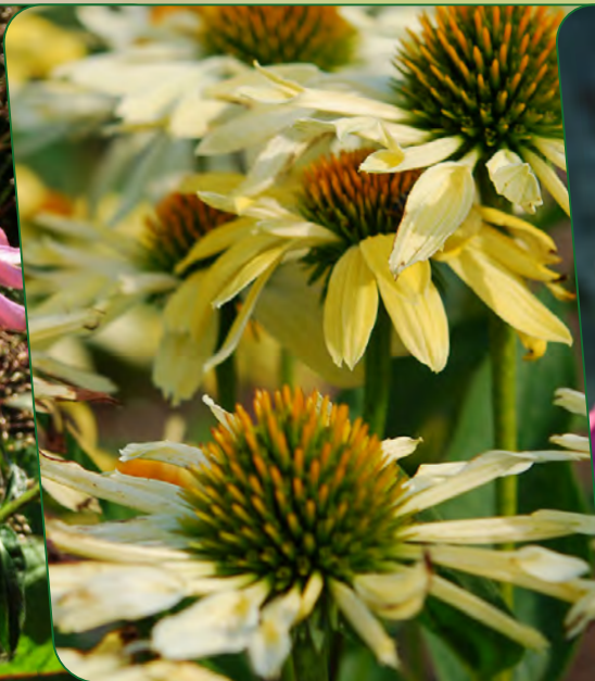
Sonnenhut | Echinacea x „Sunrise“