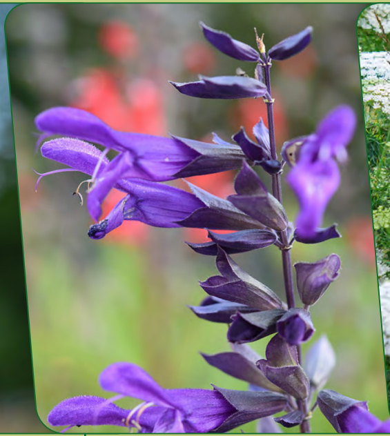
Ziersalbei | Salvia „Amistad“