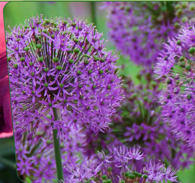
Kugellauch | Allium „Purple Sensation“