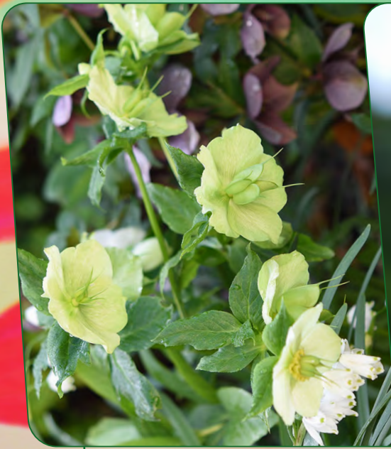
Nieswurz | Helleborus orientalis