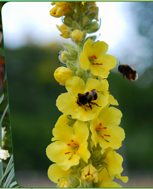
Königskerze | Verbascum nigrum